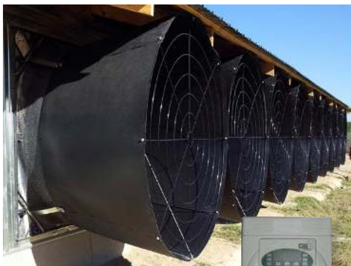
Entraîneur à fréquence variable CHORE-TIME®