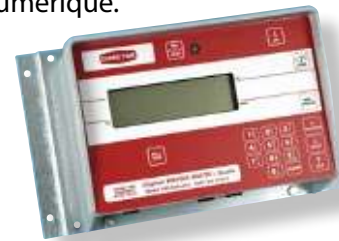
Indicateur modèle 200

conserve en permanence un inventaire de la quantité d'aliments en stock sans avoir à utiliser un silo de pesée secondaire. Le système inclut des cellules de chargement à compensation thermique et possède deux options d'indicateur de balance numérique.