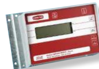
Indicateur modèle 100